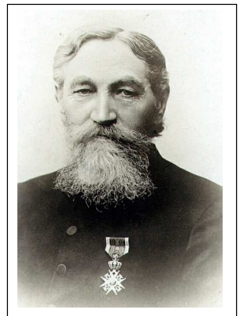
Antsirabe 2003