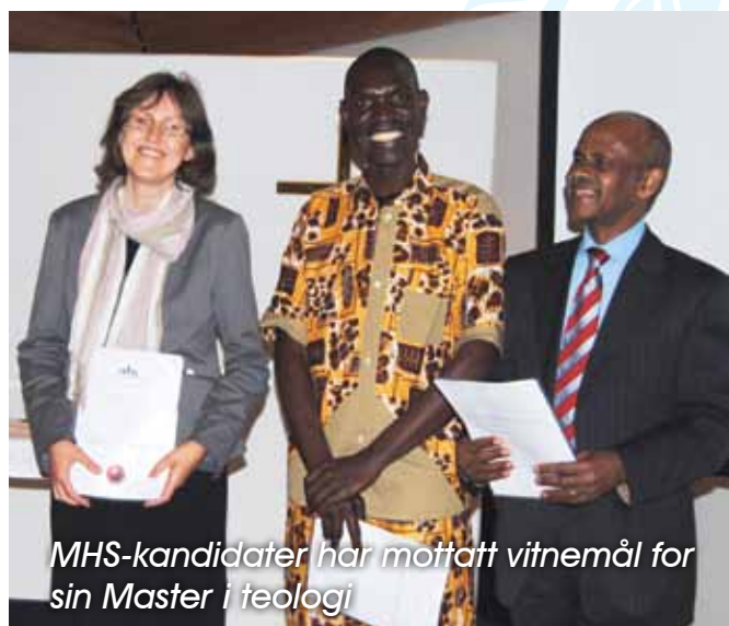
MHS-kandidater har mottatt vitnemål for sin Master i teologi

Cand.theol. 4, Master i teologi 6, Bachelor i teologi 2, Master i globale studier 16, Bachelor i religion og interkulturell kommunikasjon 10.