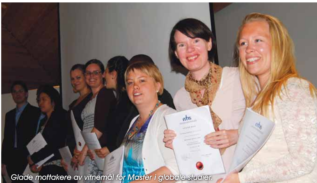
Glade mottakere av vitnemål for Master i globale studier.